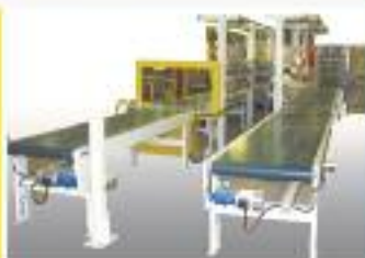
Linee complete di montaggio e di movimentazione con soluzioni personalizzate