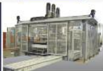
Impianti di carico e scarico fino a 30 cicli al minuto per linee di produzione

Uno staff competente che progetta e realizza soluzioni sempre più INNOVATIVE ed all' AVANGUARDIA per servire il mercato è garanzia per il cliente di ottenere realizzati gli obiettivi previsti.