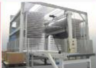
Magazzini automatici per semilavorati o prodotto finito