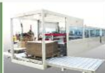
Soluzioni altamente innovative per l'imballaggio dei prodotti